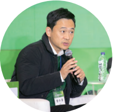
정수중 센터장 기후테크